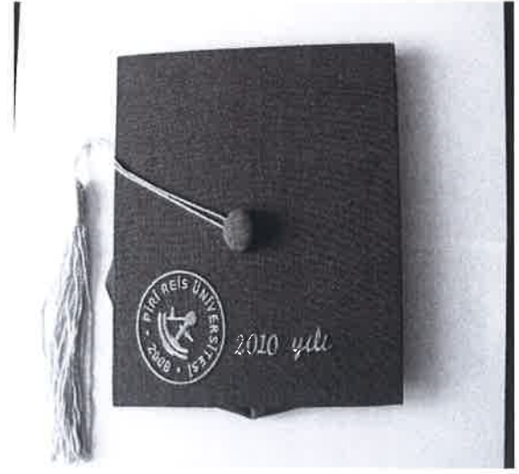
EK-G/2 ÖĞRENCİ KEPİ