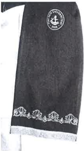
EK-E/1 ÖĞR.GÖR. ve OKUTMAN ŞALI