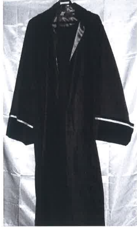
EK-B CÜBBE ve TÖREN GİYSİSİNİN GENEL GÖRÜNÜMÜ