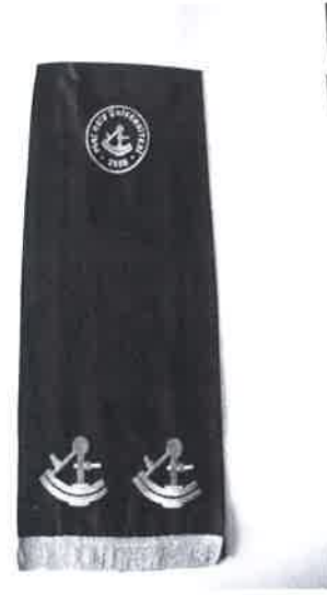
EK-D GENEL SEKRETER ŞALI