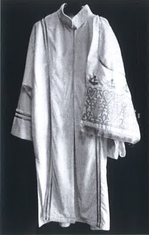
EK-A REKTÖR CÜBBESİ