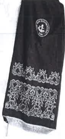
EK-B/1 PROFESÖR ŞALI