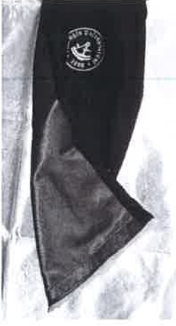
ŞAL ASTARI GÖRÜNÜMÜ