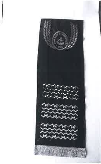
EK-C MÜTEVELLİ HEYET ŞALI