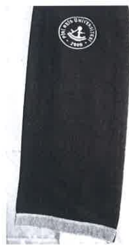
EK-E/2 ARAŞTIRMA GÖREVLİSİ ŞALI