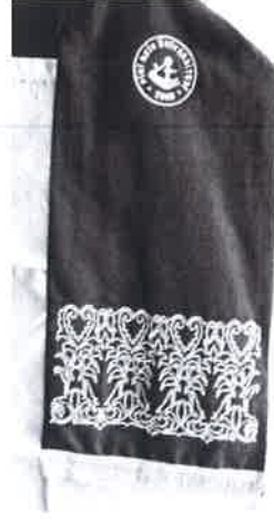
EK-B/2 DOÇENT ŞALI